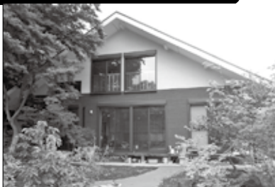
◎新築施工例 趣ある古民家風デザイン(佐倉市Y邸)

35年以上の実績 注文住宅・増改築リフォームの事なら 誠実・丁寧がモットーの太田工務店にお任せ下さい!!