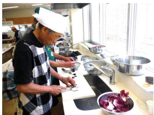
左上から ひもナス・水ナス・バジル・ミント・ トレビス・カリフラワー

当日のメニューから「豚ひき肉とトレビス・カリフラワー・ひもナス・バジルのクリームパスタ(4人前)」の作り方を紹介します！