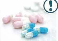
医薬品の多量摂取