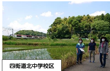
四街道北中学校区