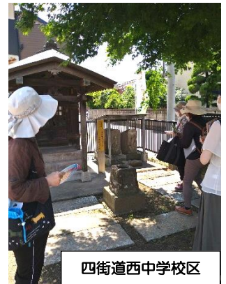
四街道西中学校区