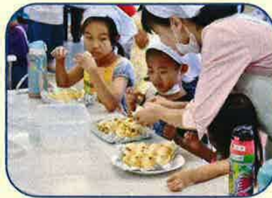
おいしくできたかな