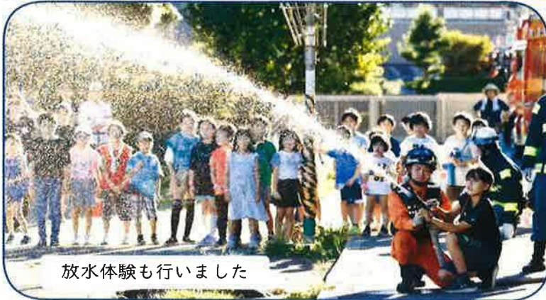
放水体験も行いました