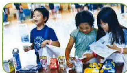
熱中症対策の展示場