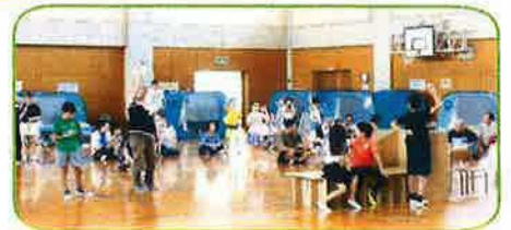
防災ゲームで防災を学ぶ