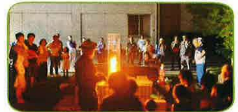
火災旋風はなぜ起きる

8月12日(土)・13日(日)の2日間、和良比小学校において、四街道市では初めてとなる、「親子防災キャンプ2023@四街道・わらび」を開催しました。このイベントはわらび子ども会が主催し、地元自主防災会・四街道市や県など10を超える関係機関が加わりました。