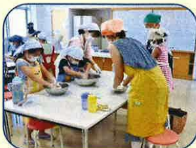
一生懸命こねこねしてパン作り