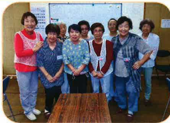
ほがらかサロンの皆さま

社会福祉協議会より借りてきた、ゲームやカルタで脳トレをして、脳の活性化を図り、認知症にならない様にしています。唱歌は歌詞を書いた冊子を作り、皆さんで大きな声で歌っています。おしゃべり好きな女性たちが言いたい放題、グチもオッケー、毒をはいてすっきり。皆さん帰りには参加して良かったと口々に言って下さいます。また、年に何回か、焼きソバ・ソーメン・きりたんぼ鍋を楽しみにして作って食しています。