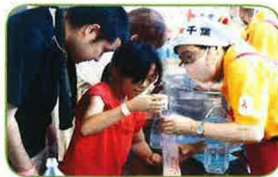
非常食を使った炊き出し訓練