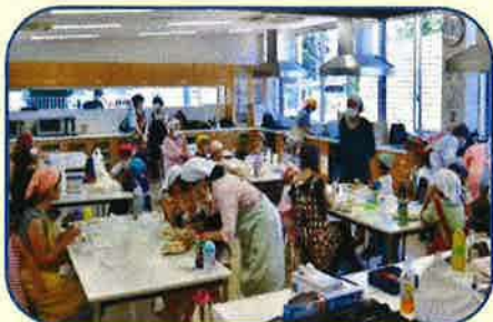
みんなで楽しくクッキング中