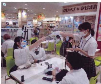
フードコートでの啓発活動

七月二十九日（金）快晴の夏空の下、市内高等学校の生徒の代表も参加して、令和四年度県下一斉合同パトロールが開催されました。