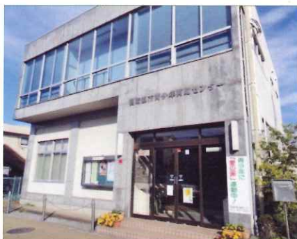
四街道市青少年育成センター