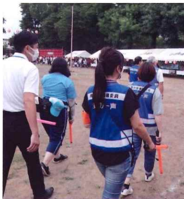
ふるさとまつり警備の様子

コロナウイルスの感染防止対策として一日のみの開催となりましたが、三年ぶりの開催ということもあり、多くの市民と子どもたちが集ってきました。