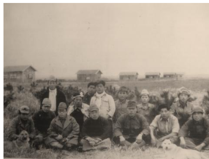
開拓住宅を作った若き「たくみ」の面々