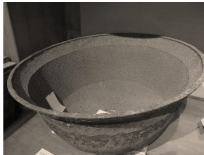
共同炊飯で使用された大釜