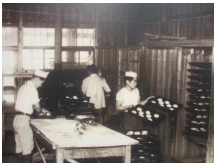
地産小麦を使った製パン作業