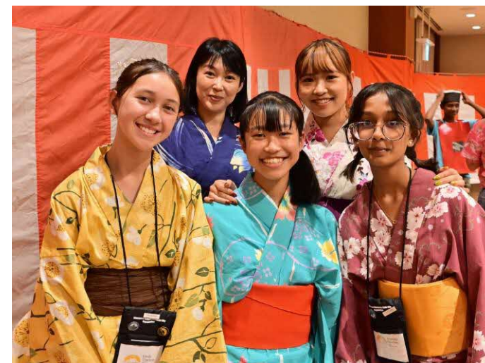
アメリカ合衆国リバモア市からの短期留学生との交流の様子