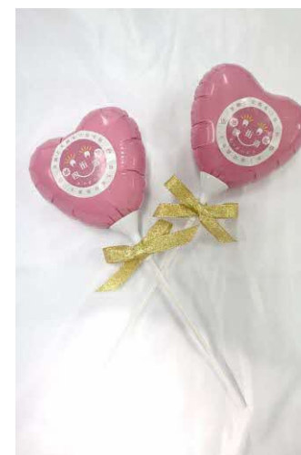
記念撮影用バルーン