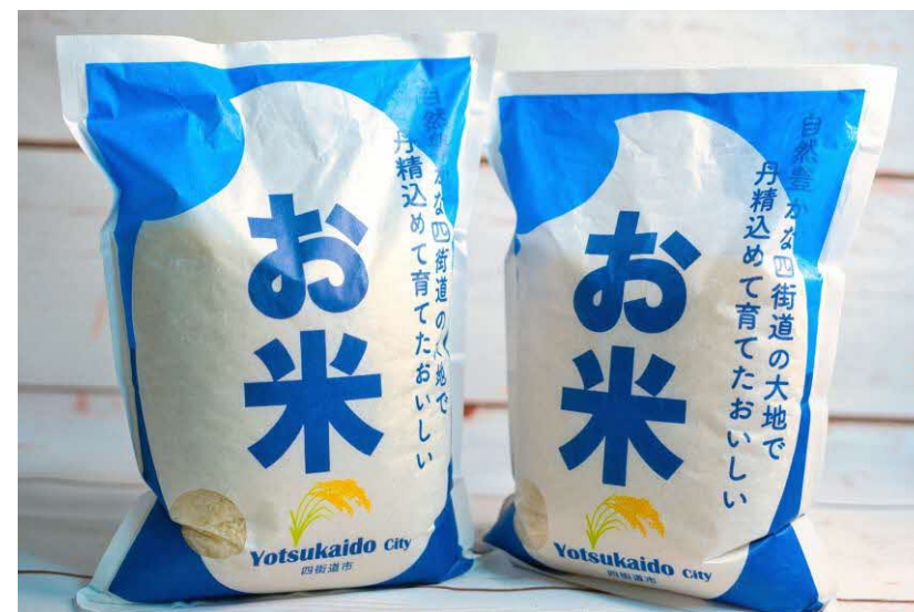
お届け便のイメージ