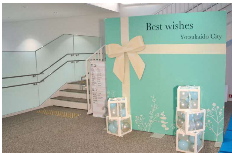
メモリアルフォトブース